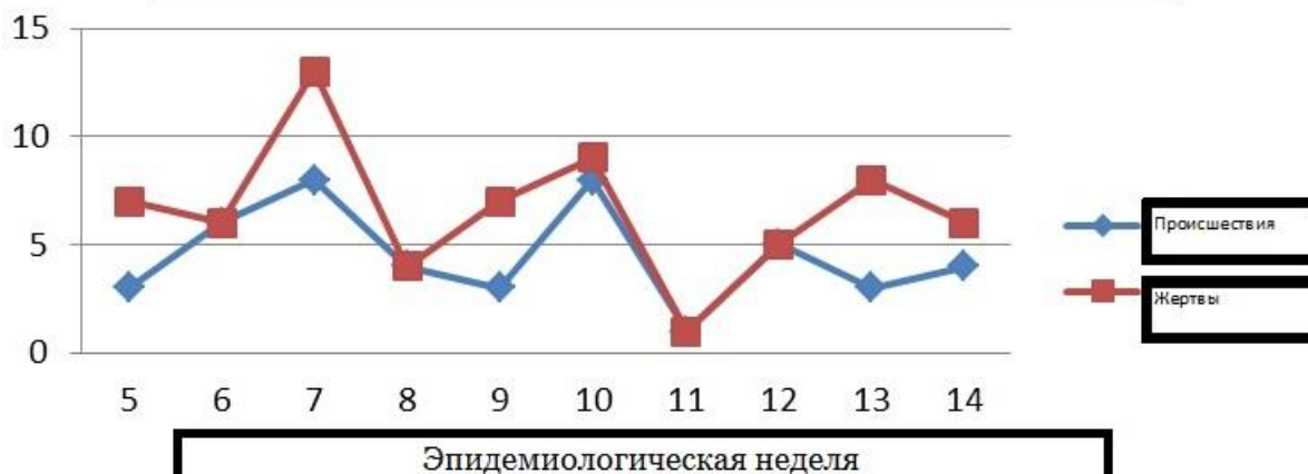
Происшествия и жертвы, связанные со взрывными устройствами в районе Айн-эль-Араба/Кобани (2015)

В 45 случаях, показанных выше на графике, 47 человек погибли и 19 получили ранения. Медицинский персонал больницы сообщил, что 80% пострадавших были гражданскими лицами. Большинство (85%) жертв были мужчинами. Более половины (53%) жертв были моложе 30 лет; четверо — это дети младше 15 лет.